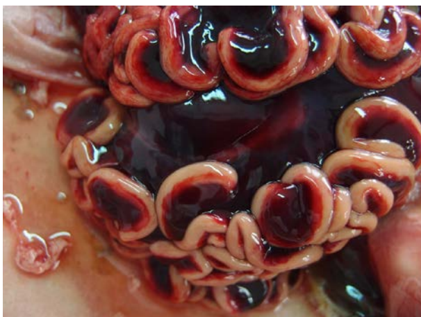
7. Feto 1. Edema y hemorragia mesentérica