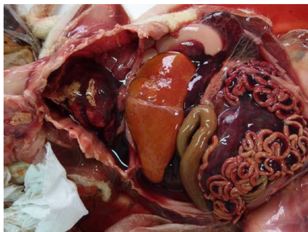
4. Hígado (hepatitis periportal)