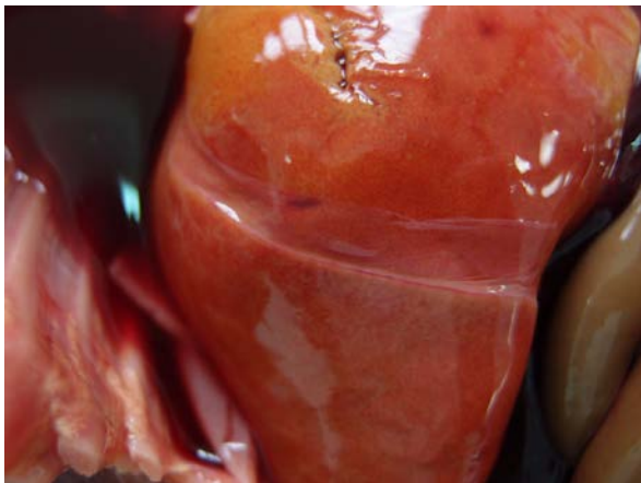
5. Feto 1. Hígado (hepatitis periportal)