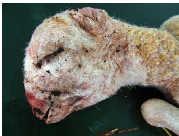
2. Malformación craneal