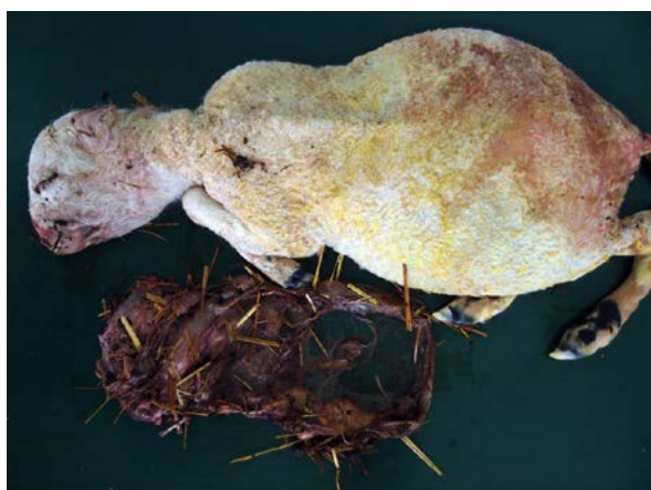
1. Feto y placenta