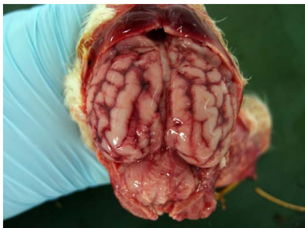
3. Feto 1. Encéfalo (leucomalacia)