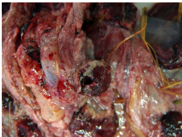
3. Fragmento izquierdo