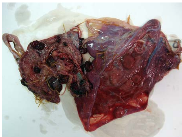
1. Placenta de aborto gemelar

Aborto clamidial ovino. Placenta de fetos gemelos con patrones lesionales diferenciados. En el fragmento de la izquierda se observa placentitis supurativo-necrótica con marcado engrosamiento coriónico. En el fragmento de la derecha se observa congestión y abundante exudado sero-fibrinoso. En ambos casos se detectaron clamidias, tanto por microscopía como por PCR. Ambos perfiles lesionales se observan con frecuencia en abortos por Chlamydochlamydia y por Coxiella