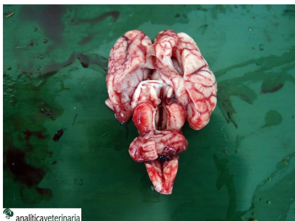
3. Hipoplasia cerebelar