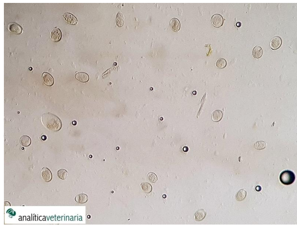
4. Ooquistes de Eimeria. Examen directo